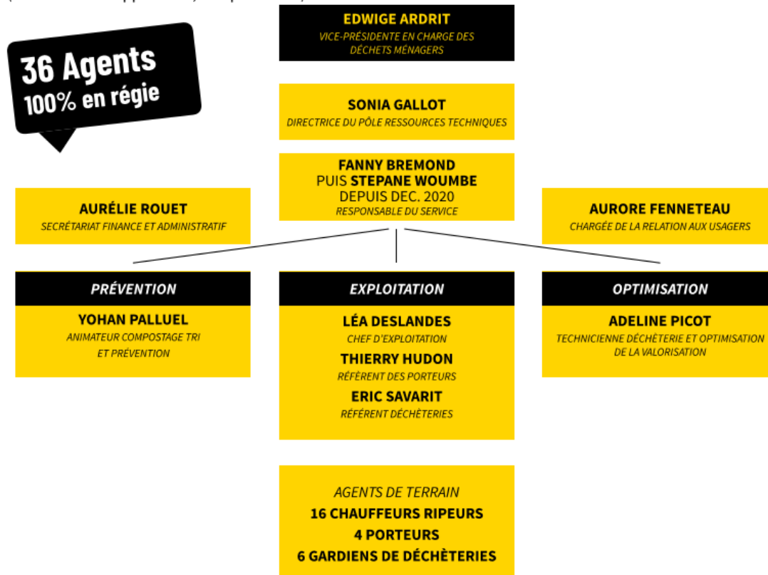
Figure 4 : Organigramme du pôle aménagement durable du territoire (source : RA 2020)

(Hors services support : RH, comptabilité...)