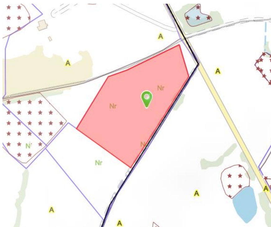
Figure 2 : Extrait du zonage du PLUi (source : géoportail de l'urbanisme)

Selon le règlement du PLUi, la zone Nr autorise les occupations et utilisations du sol sous-conditions :