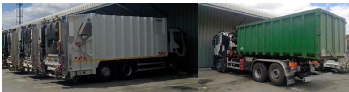
Figure 2 : Bennes à ordures ménagères (à gauche) et camion porteur (à droite)

L'entretien du matériel roulant est assuré par le biais d'une convention d'Entente avec la Ville de Thouars. Les déchèteries sont entretenues par les services techniques de la Communauté de Communes du Thouarsais.